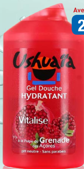
USHUAÏA Douche Grenade 250ml