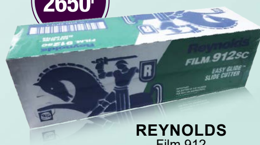
REYNOLDS Film 912