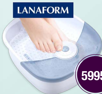
BAIN BULLES LA110414