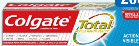
COLGATE 75ml Dentifrice Total Action Visible