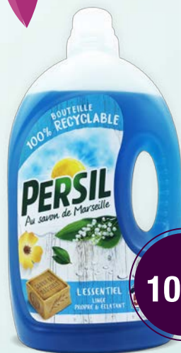
PERSIL 52 lavages 2,6L